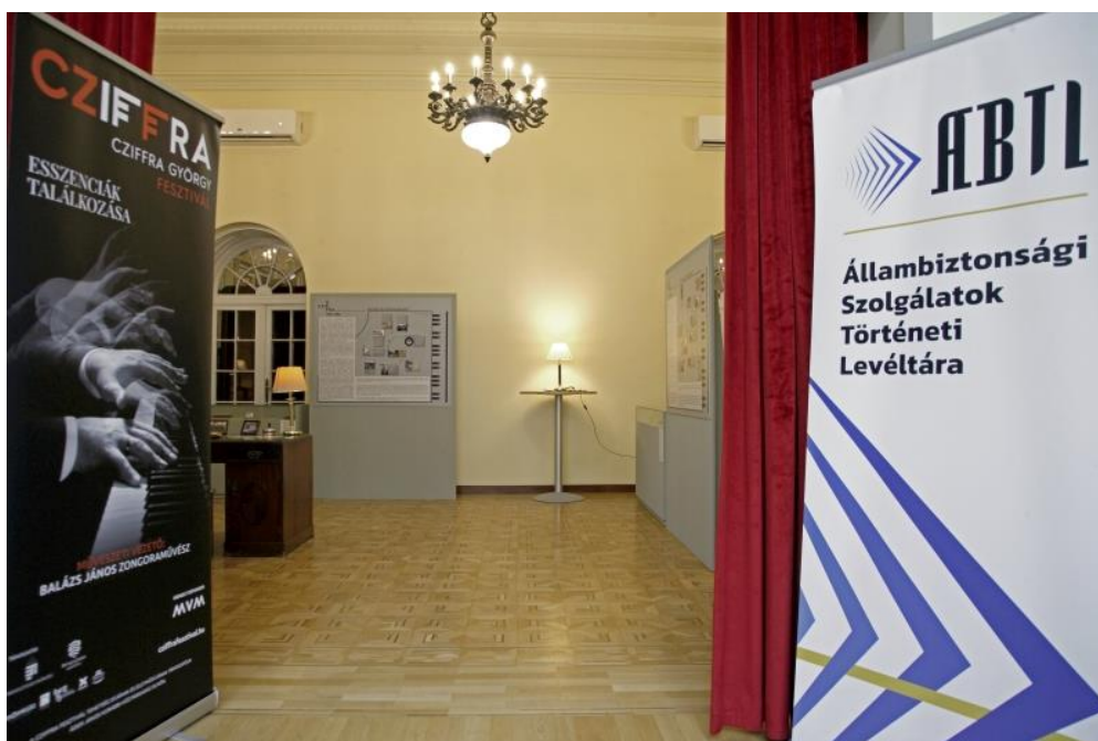
A kiállítás „bejárata”