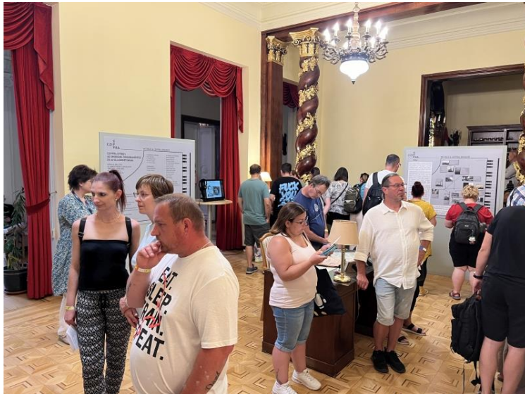
Látogatók a Múzeumok Éjszakáján