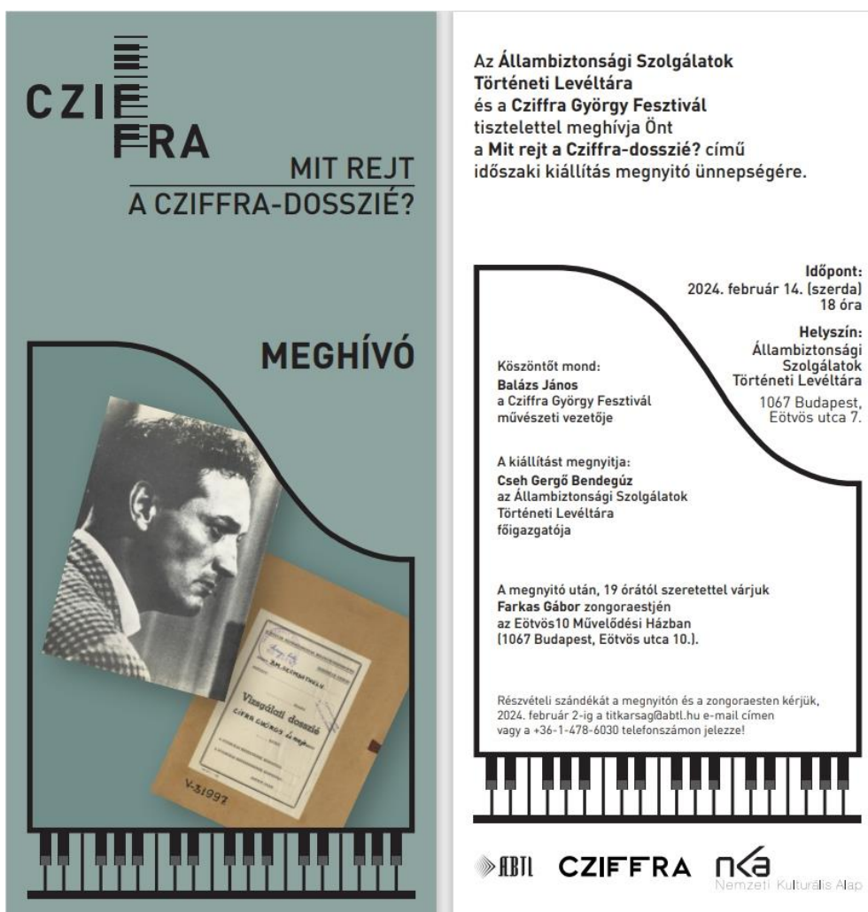
Meghívó a megnyitóra