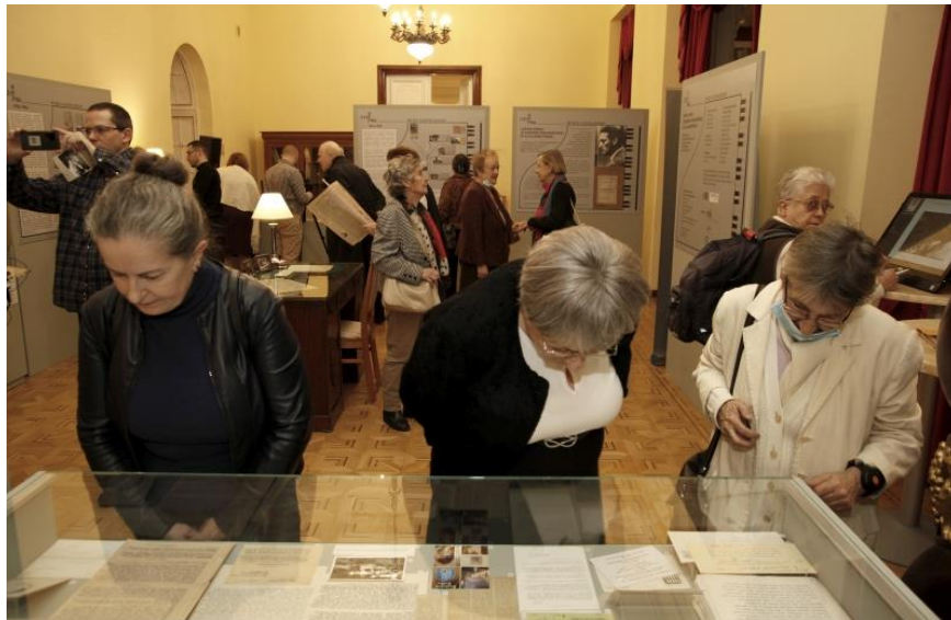
Mit jelentettek Cziffról?