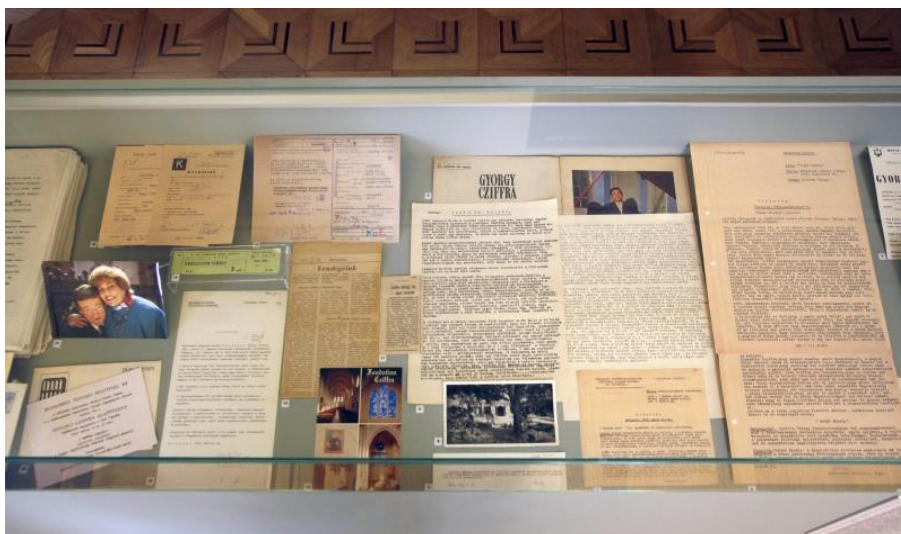
A dokumentumok között számos, Cziffra Györgyről szóló állambiztonsági jelentés olvasható