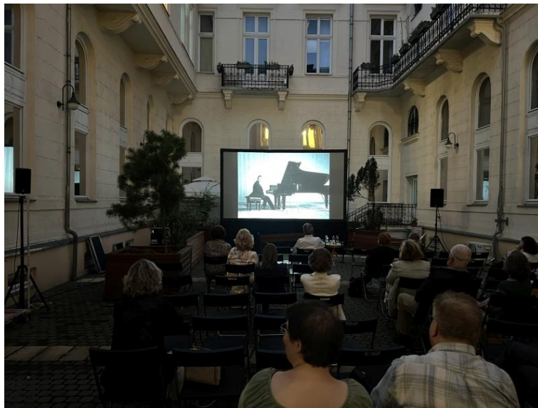
„Tele van a két kezem boldogsággal” c. film vetítése az ÁBTL udvarán a Múzeumok Éjszakáján