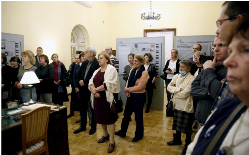
A kiállítás megnyitóján