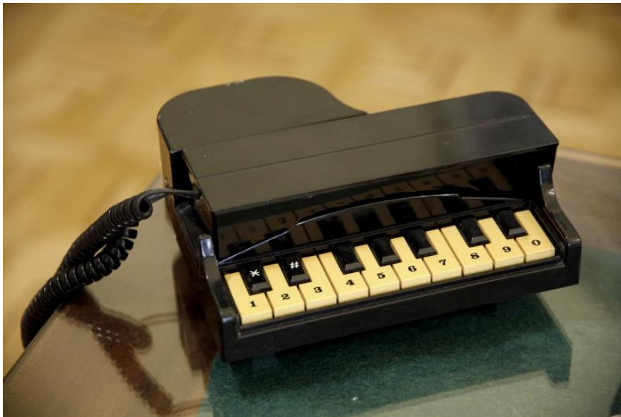
Cziffra György telefonja