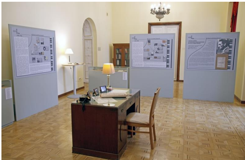
Az enteriőr egyben interaktív elem, a látogató odaülve lapozgathatja a „Cziffra újságot”