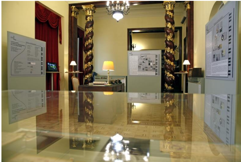
A kiállítás egy tárló szemszögéből